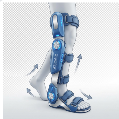
ウェルウォーク （ロボットリハビリ）