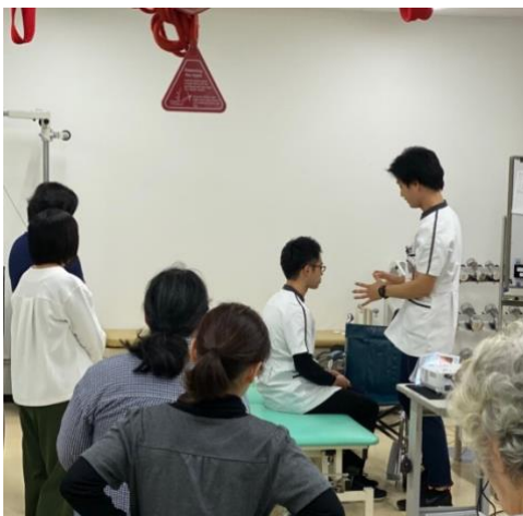
講義風景（デモンストレーション）