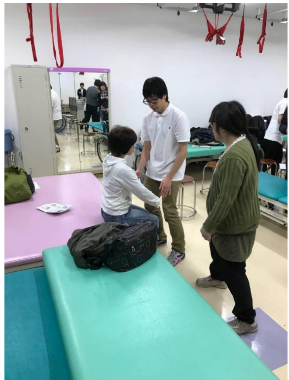
各グループで実技練習をしています。