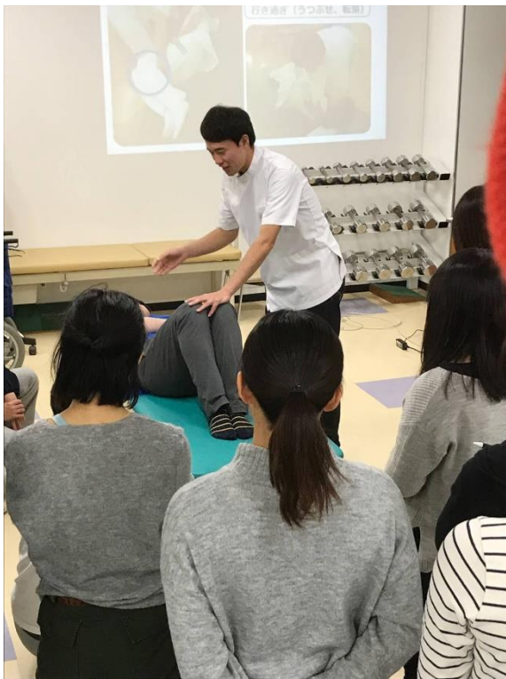
前でデモンストレーションをしています。

今年の参加者は30人でした。6グループに振り分け、各グループに講師を1～2人配置し、講義と各グループでの実技を行いました。経験年数でグループ分けを行い、それぞれ疑問を発言しやすい空気で行いました。