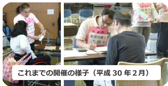
これまでの開催の様子(平成30年2月)