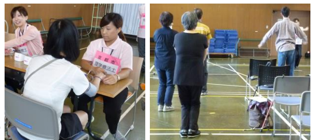
これまでの開催の様子(平成29年9月)